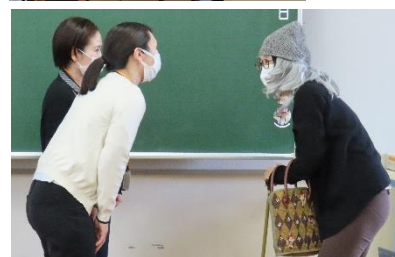
【サポーターの方によるロールプレイ】