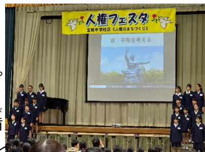
【6年生：「今、平和を考える」】

このか 9日(土)、宝城中学校区の「人権のまちづくり」活動の一つとして、 人権フェスタが行われました。中学2年生が職場体験で学んだことを 発表し、中学1年生は、大刀洗空襲の学習で学んだことを発表しました。 卒業生が中学校でも頑張っている姿は頼もしいものでした。小学校か らは56年生が平和について考えていることを発表しました。短い準備 期間の中で、自分たちが学んだことを呼びかけと歌でしっかり伝えること ができたと思います。ご協力、ご参加いただきました地域の皆様、保護者 の皆様、ありがとうございました！